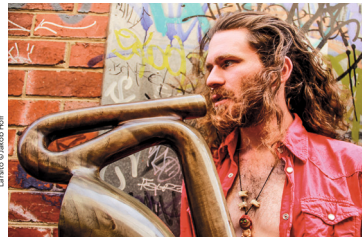
LEGENDARY STRAWBERRY MAN © MICHAEL BLAU