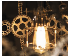
LEIFER © JACOBS HOF