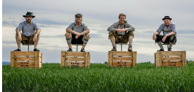
ALPIN DRUMS